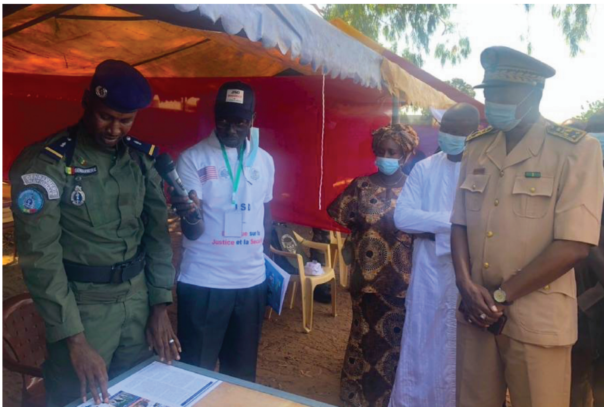
Rencontre entre le préfet à Goudomp, le maire, les populations et le chef de la gendarmerie locale.

La Casamance illustre comment les interventions du DJS ont contribué à établir des canaux d'interaction prévisibles entre les communautés et les services de sécurité, permettant ainsi la circulation de l'information avant que les menaces ne s'aggravent. Adaptées aux conditions locales, des approches similaires pourraient aider l'est du Sénégal à renforcer de manière proactive à la fois sa posture défensive et la résilience des communautés face aux risques émergents. La prévention, en ce sens, n'est pas simplement une question de posture ou de présence, mais d'engagement durable permettant d'identifier les risques à un stade précoce et d'y remédier de manière collaborative grâce à un dialogue inclusif et à une résolution coopérative des problèmes.