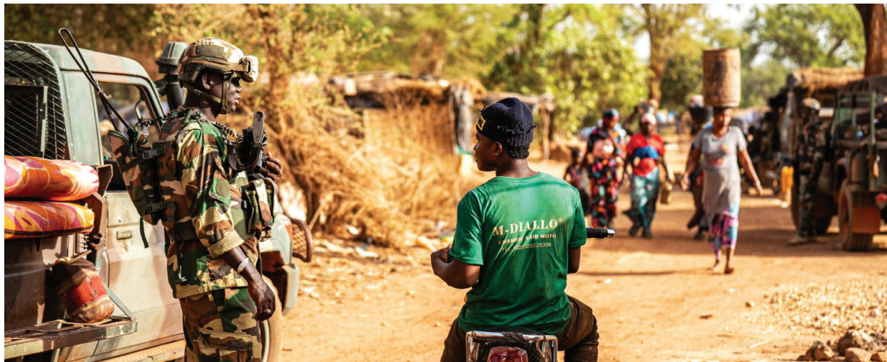
Un soldat sénégalais interroge un homme sur un site d'exploitation artisanale d'or près de la frontière malienne.

L'expérience du Sénégal en Casamance montre que l'instauration d'un climat de confiance entre les forces de sécurité et les communautés locales est un moyen pratique essentiel pour obtenir leur coopération et prévenir toute mobilisation vers la violence.