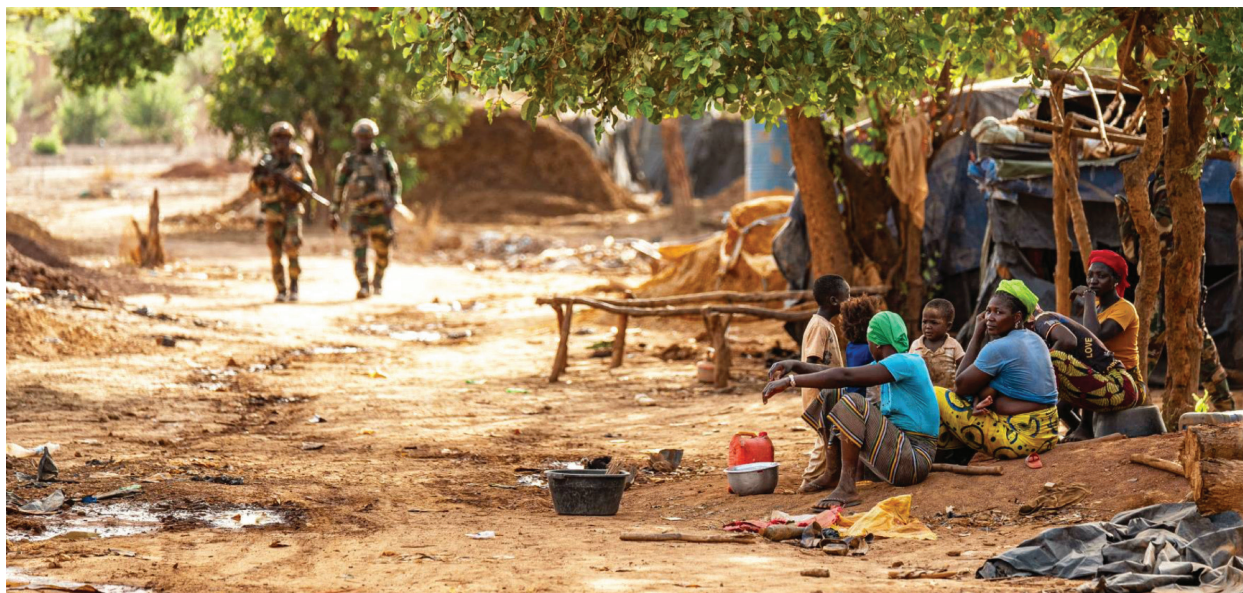
Des soldats sénégalais patrouillent dans une communauté minière artisanale près de la frontière malienne.

Ces expériences suggèrent que la sécurité préventive dans l'est du Sénégal dépendra d'un engagement communautaire soutenu et d'une adaptation au contexte local. De tels mécanismes — alliant un dialogue régulier, une différenciation plus claire des rôles entre la police, la gendarmerie et les acteurs militaires, ainsi qu'un système d'alerte précoce ancré localement — offrent un modèle pour renforcer les capacités de prévention. L'adaptation de ces approches à la dynamique frontalière dans l'est du Sénégal, y compris la coordination transfrontalière entre les autorités locales, pourrait aider à identifier et à gérer les risques avant qu'ils ne se transforment en menaces plus tenaces.