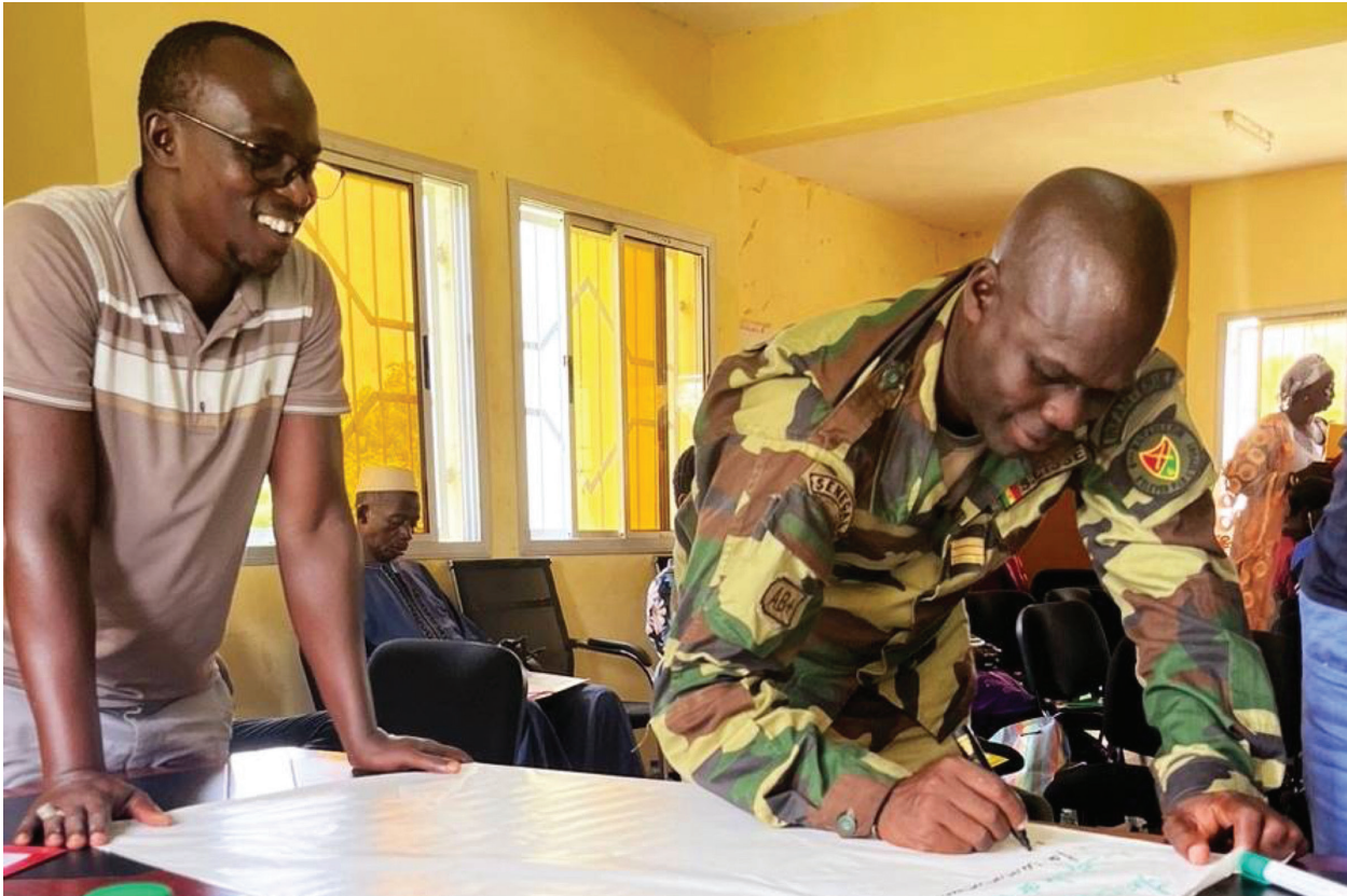
Une session de dialogue dans le département de Goudomp.

À Goudomp, le processus de dialogue a également contribué à redéfinir les relations entre les autorités locales et les services de sécurité. Avant le DJS, la mairie avait peu d'interactions avec la gendarmerie. Le premier échange structuré entre l'adjoint au maire et la gendarmerie, facilité par le DJS, a révélé que le poste de gendarmerie local était en mauvais état, ce qui a incité la municipalité à soutenir sa rénovation. En conséquence, les habitants ont pu accéder à des services juridiques et notariaux de base au niveau local plutôt que de parcourir plus de 50 km sur un terrain dangereux, renforçant ainsi la perception du gouvernement comme un fournisseur concret de sécurité et de services.