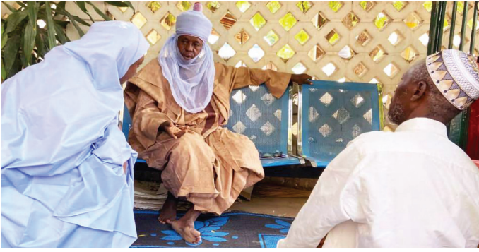
Programme d'initiatives communautaires pour la promotion de la paix (CIPP) à Kano, au Nigeria.

migration, ainsi que les ambiguïtés en matière de propriété foncière entre les systèmes coutumiers et statutaires. L'inclusion des questions de genre et l'engagement des jeunes ont été intégrés dans la conception du programme. Des dialogues structurés avec les acteurs gouvernementaux ont permis de faire progresser des mesures politiques et des pratiques d'adaptation au changement climatique susceptibles de réduire la pression sur les ressources.