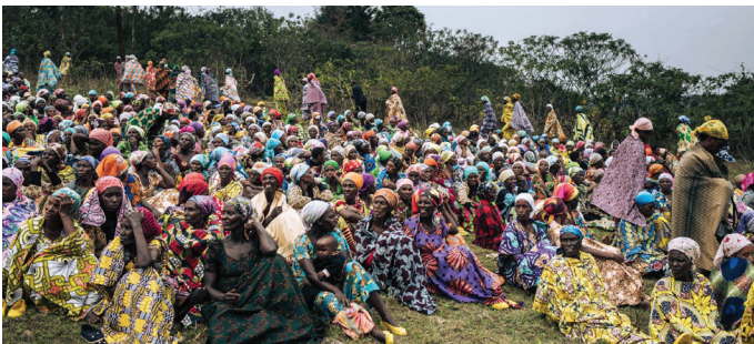
Des femmes de la communauté banyamulenge, dans l'est de la RDC, assistent aux funérailles d'un éleveur tué par une milice armée.

Dans le cadre du programme PEACE au Niger, les villages touchés par le conflit et confrontés à des tensions intercommunautaires exploitées par des groupes extrémistes violents ont bénéficié d'un ensemble de mesures de mobilisation communautaire et de planification participative. Le programme a donné lieu à des projets communautaires communs, notamment des initiatives de médiation et de dialogue, la réhabilitation des infrastructures, la gestion des ressources naturelles, le soutien aux moyens de subsistance et des événements culturels. Ces activités visaient à renforcer la cohésion sociale au-delà des clivages ethniques, entre citoyens et gouvernement, et autres lignes de division, afin de compliquer la tâche des groupes extrémistes violents qui cherchent à exploiter les différences identitaires et les sentiments de marginalisation.