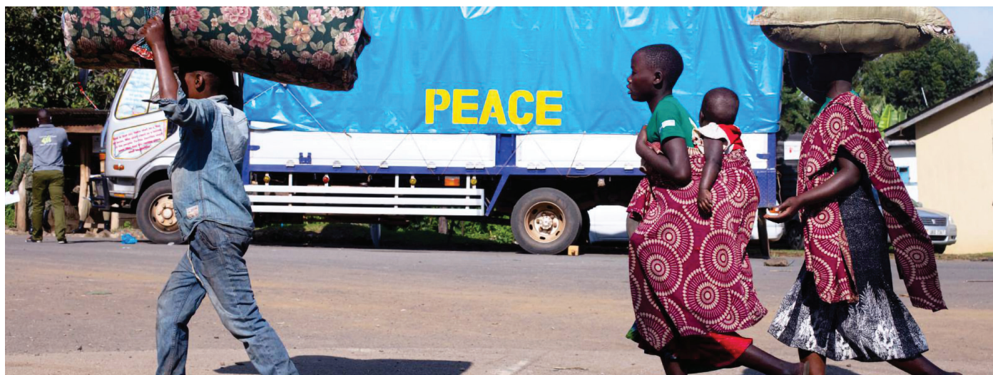
Des demandeurs d'asile originaires de la République démocratique du Congo transportent leurs effets personnels au poste-frontière de Bunagana, en Ouganda.

La résolution des conflits s'articule principalement autour de processus de paix nationaux, comme des négociations entre élites ou des accords de paix entre belligérants armés. La consolidation de la paix au niveau communautaire est ainsi systématiquement négligée, créant un déséquilibre qui nuit à l'atténuation et à la prévention des conflits. Or, la plupart des gens sont confrontés à la violence au sein de leurs communautés. C'est en effet au niveau communautaire que les griefs sont exprimés, que les conflits éclatent et que la confiance dans les institutions se construit ou s'érode. Compte tenu de la dimension intercommunautaire de nombreux conflits africains, les processus de paix sont donc insuffisants s'ils ne s'engagent pas également dans la consolidation de la paix au niveau communautaire.