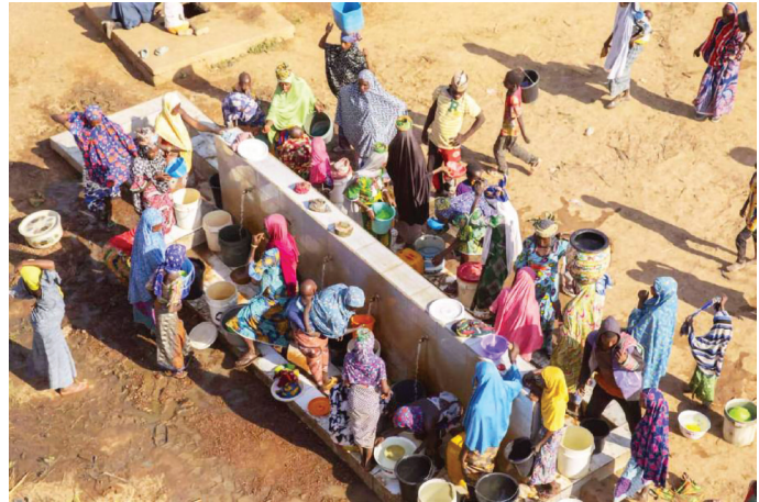
Des éleveurs et des agriculteurs se retrouvent à un point d'eau au Nigeria.

L'IBMN est généralement dispensée sous la forme de formations en groupe de 2 à 5 jours (d'une durée maximale de 40 heures) réunissant 25 à 35 participants, adaptées au public et aux objectifs du programme. Les sessions sont parfois échelonnées pour permettre des simulations, une large participation et une application concrète des compétences acquises. Les éléments clés combinent une introduction au cadre fondé sur les intérêts, des concepts clés et des jeux de rôle. Des exercices visant à développer une compréhension pratique, des discussions permettant d'adapter le cadre au contexte local et des renvois vers des mécanismes administratifs ou de résolution des conflits, lorsque cela est possible, sont également proposés afin que les accords puissent « s'étendre » au-delà du niveau communautaire.