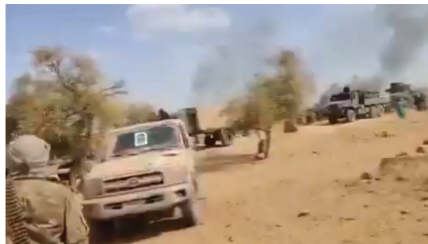
Des paramilitaires russes se retirent de Kidal après des attaques du FLA. (Capture d'écran)

Les attaques réfutent les affirmations de la junte selon lesquelles leurs stratégies sécuritaires auraient stabilisé le Mali. Elles démontrent plutôt un fossé grandissant entre les déclarations des juntes sahéliennes et les conditions sur le terrain. Par ailleurs, les opérations intensives d'information sponsorisées par la Russie, louant ses succès et ceux des juntes sahéliennes dans leurs combats contre les insurrections des extrémistes violents, ont alimenté une bataille de discours parallèles en l'Afrique de l'Ouest, des batailles qui ne tiennent pas en compte des réalités sécuritaires.