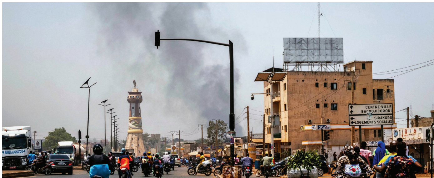
Une colonne de fumée noire se lève sur Bamako après les attaques du 25 avril.

Les attaques synchronisées perpétrées par des islamistes militants et des séparatistes dans tout le Mali reflètent une détérioration constante de la sécurité. Une coalition plus large de partenaires domestiques, régionaux et internationaux sera nécessaire pour y remédier.