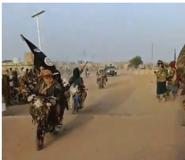
Les forces du JNIM entrent dans Kidal. (Capture d'écran)

Pour le FLA, la reprise de Kidal reflète un effort continu pour réaffirmer son contrôle sur le nord après la décision de la junte malienne de mettre fin à l'Accord d'Alger et de prendre Kidal par la force en novembre 2023. La décision de la junte d'ouvrir un deuxième front contre les Touareg, plutôt que de se concentrer sur la menace des islamistes militants ailleurs, a provoqué la saturation extrême des chaînes d'approvisionnement militaires dans un contexte où les ressources étaient déjà limitées.