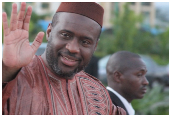
Moussa Mara, l'ancien Premier ministre malien

Depuis la prise de pouvoir par la junte, la détérioration de la sécurité se déroule dans un contexte de resserrement systématique de l'espace politique et civique. Les promesses d'une transition et d'un retour du pouvoir aux civils ont été maintes fois reportées. Des personnalités civiles importantes, y compris l'ancien Premier ministre modéré et séculaire Moussa Mara, ont été détenues ou mises à l'écart pour voir appelé à un retour à l'ordre constitutionnel. Ce rétrécissement de l'espace politique a limité les voies pour pallier les défis de gouvernance, tout en augmentant la pression sur l'armée pour gérer simultanément des crises non seulement sécuritaires, mais aussi politiques, diplomatiques et économiques.