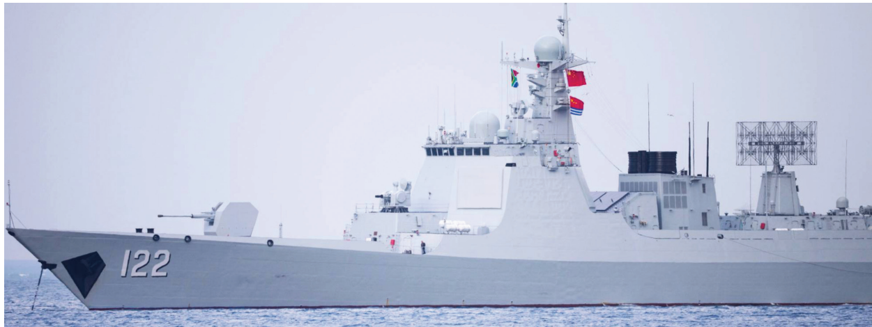
Le destroyer lance-missiles chinois Tangshan, amarré près du Cap, en Afrique du Sud, le 6 janvier 2026.

politiques des transferts chinois dans des contextes fragiles et autoritaires continueront de croître, car le ministère chinois de la Sécurité publique mène davantage d'engagements en Afrique que le ministère chinois de la Défense et l'APL, souvent à l'abri du regard du public.