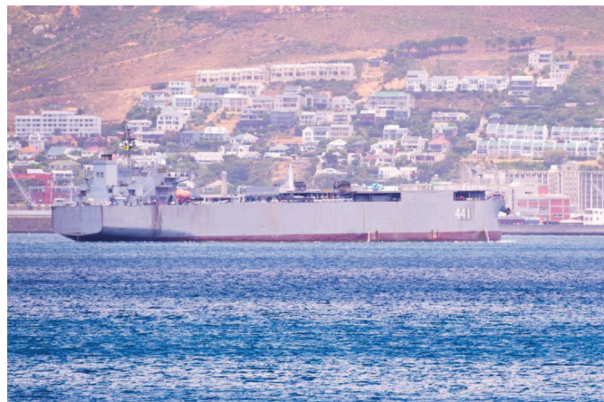
Le navire de la marine iranienne IRIS Makran 441 près du Cap, en Afrique du Sud, le 8 janvier 2026.

Au cours des 18 derniers mois, l'APL a mené trois exercices militaires en Afrique, chacun marquant un changement qualitatif. En août 2024, les exercices « Amani na Umoja » (Paix et unité) de deux semaines avec la Tanzanie et le Mozambique ont représenté le plus grand déploiement jamais réalisé par l'APL en Afrique. Contrairement aux exercices précédents qui s'appuyaient sur les groupes d'escorte anti-piraterie de la marine de l'APL dans le golfe d'Aden, cet exercice a déployé des unités directement depuis la Chine continentale, en utilisant des moyens de transport stratégiques de la marine et de l'armée de l'air, notamment des avions de transport Y-20 et des docks de débarquement amphibies de classe Yuzhao. Il comprenait à la fois des opérations terrestres en Tanzanie et des opérations navales dans les eaux mozambicaines, ce qui constituait une première dans les exercices de l'APL en Afrique.