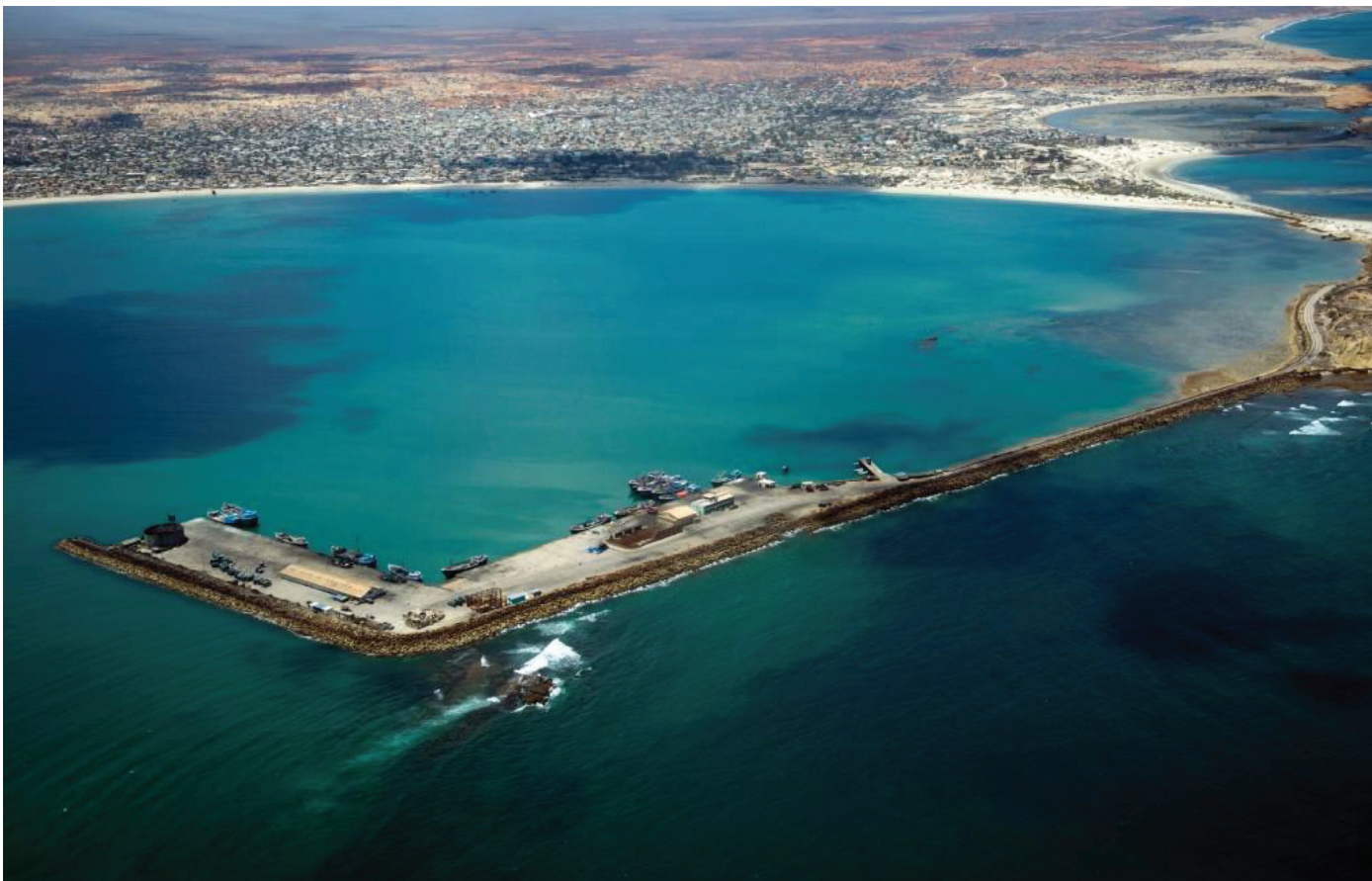
Porto de Kismayo, Somália.

Durante o segundo mandato de HSM, Damul Jadiid e Al I'tisaam estabeleceram um modus vivendi rancoroso, mediado pelo seu patrono comum, o Qatar. Damul Jadiid domina o poder executivo, enquanto um proeminente clérigo da Al I'tisaam, o Xeque Bashir Salaad, preside ao Conselho Ulemá nacional. O Damul Jadiid é habitualmente descrito como mais “progressista” do que outros grupos islamistas somalis, mas o conservadorismo e o fanatismo religioso de alguns altos funcionários são do domínio público. Além disso, as controversas alterações constitucionais da Villa Somália estão impregnadas de jurisprudência salafita, proposta por acadêmicos de al I'tisaam, incluindo disposições que violam as obrigações da Somália em matéria de direitos humanos enquanto membro da União Africana (UA) e das Nações Unidas (ONU). 11