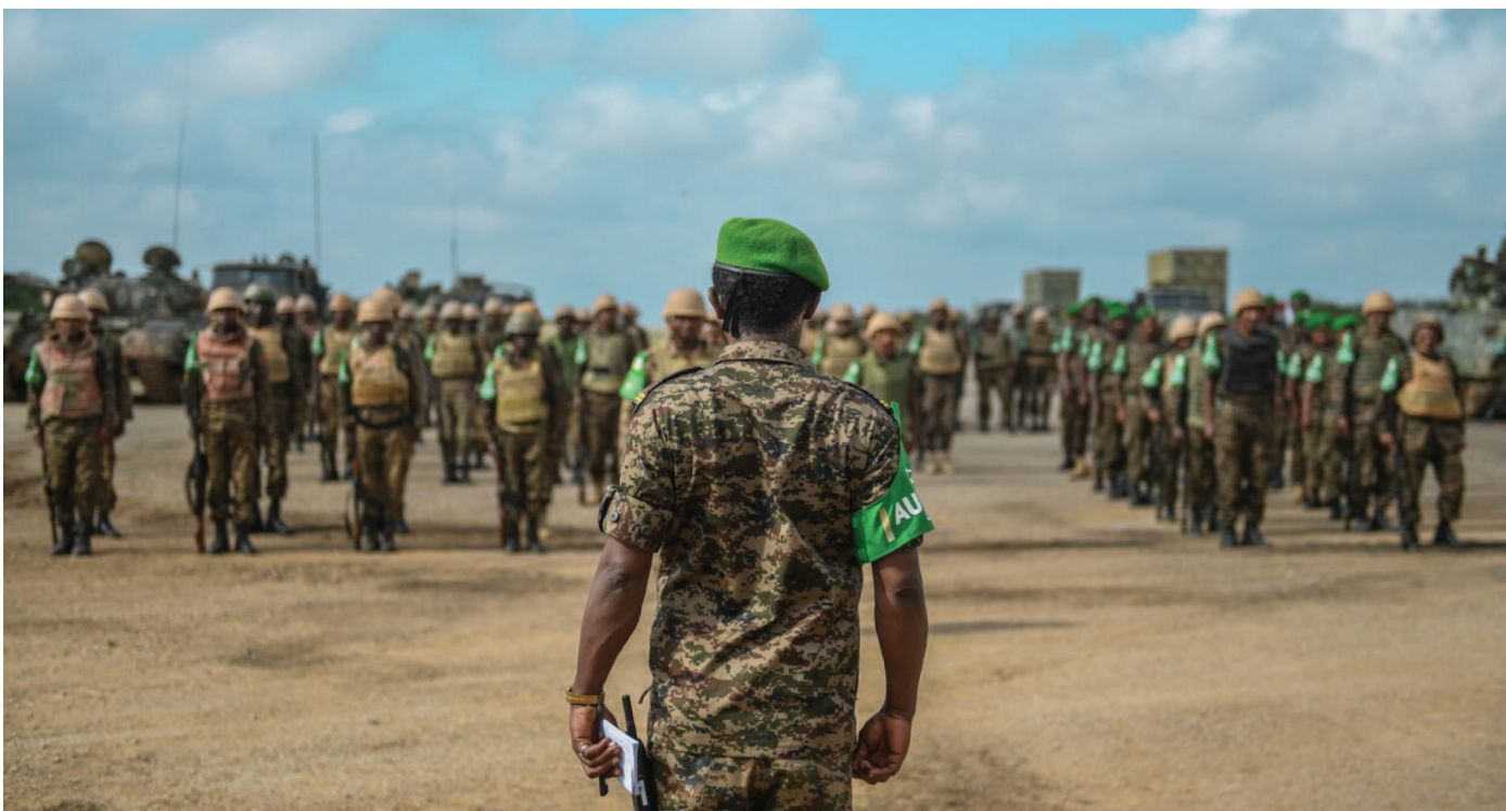
Formatura de soldados da AUSSOM em formação.

político mais amplo de Villa Somália do federalismo para um Estado centralizado e unitário. 20 Perdeu-se o ímpeto contra os militantes e a federação começou a desgastar-se. O nome da AMISOM foi alterado de forma otimista para Missão de Transição da UA na Somália (ATMIS), sem que se vislumbrasse o fim da “transição.”