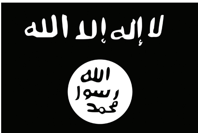
Variante da bandeira utilizada pelo Al-Shabaab.

outras forças políticas somalis poderiam, independentemente do FGS, unir forças contra esta ameaça comum. A Etiópia, o Quênia, os EAU e os Estados Unidos demonstraram de forma convincente o valor da parceria direta com as forças estatais e locais e devem manter esta opção.