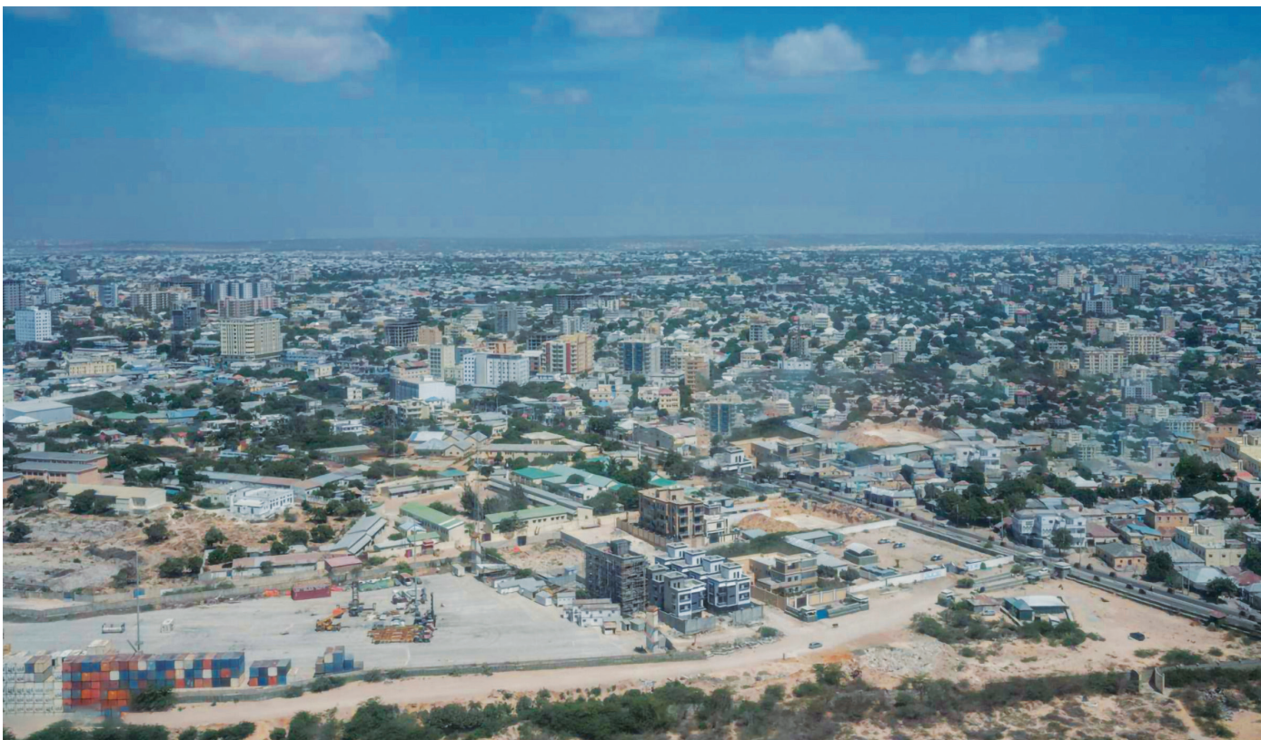
Vista aérea de Mogadíscio.

ao federalismo fiscal, à gestão dos recursos naturais e aos serviços sociais, “deverá ser negociado e acordado entre o Governo Federal e os Estados-Membros Federais.” 6