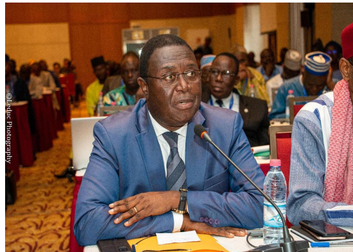
Presidente da Suprema Corte do Benim