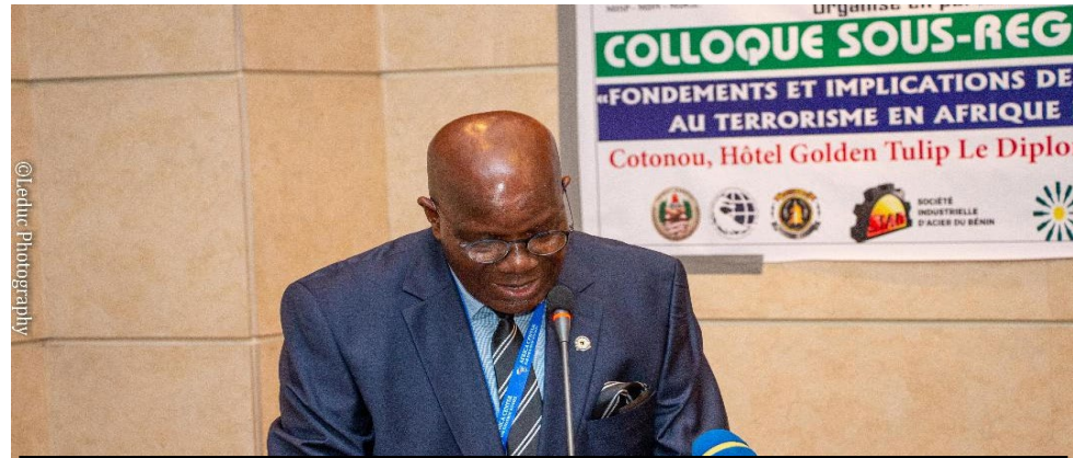
AMB VIGNIKIN SEC/ORGAN