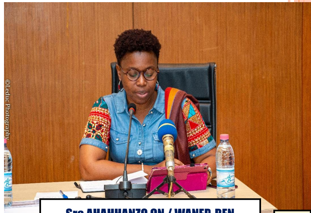
Sra AHAHANZO CN / WANEP-BEN