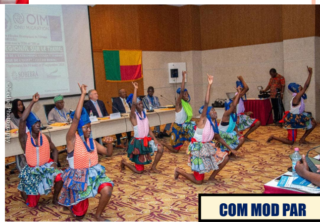
COM MOD PAR