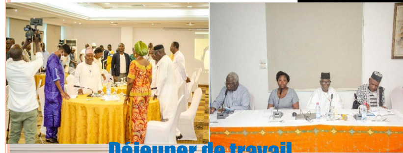
Déjeuner de travail