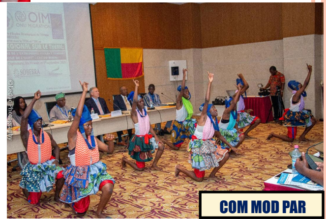
COM MOD PAR