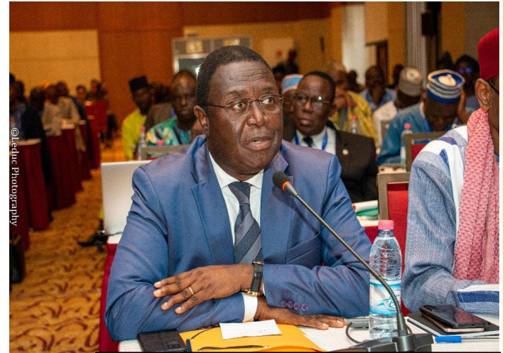
PRESIDENT COUR SUPREME BENIN