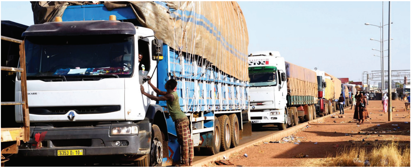
Des camions chargés de marchandises attendent de traverser un poste frontalier commercial du nord du Togo avec le Burkina Faso.

L'orpaillage est également important dans toute cette zone, ce qui attire des travailleurs migrants, non seulement des trois pays mais aussi de la Guinée. Pendant le conflit ivoirien des années 2000, ces sites artisanaux ont généré des revenus importants en soutien aux groupes armés du nord du pays. La confluence des flux commerciaux, de l'orpaillage, des réseaux de contrebande et du trafic d'armes constitue une cible d'influence attrayante pour les groupes islamistes militants de la sous-région.