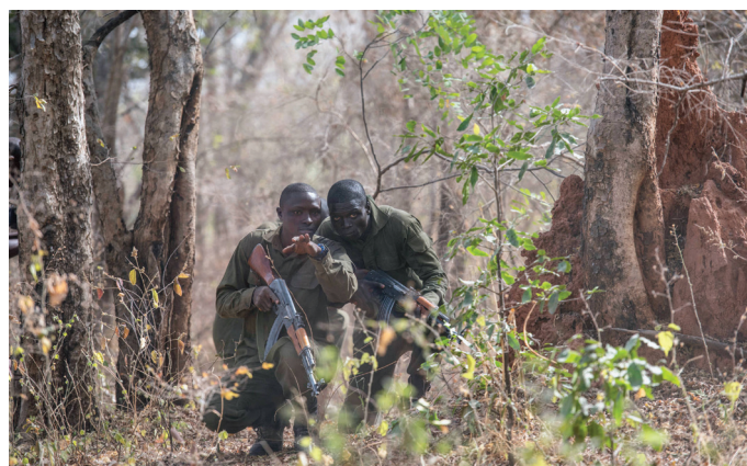
Des forces de sécurité s'entraînent à la formation et à la communication pendant un entraînement près du Parc national de la Pendjari au Bénin.

À la suite d'un attentat très médiatisé à Grand-Bassam en Côte d'Ivoire et de l'expansion de la violence des islamistes militants du Mali au Burkina Faso, le gouvernement burkinabè et ses quatre voisins côtiers – le Bénin, la Côte d'Ivoire, le Ghana et le Togo – ont, en 2017, mis en place