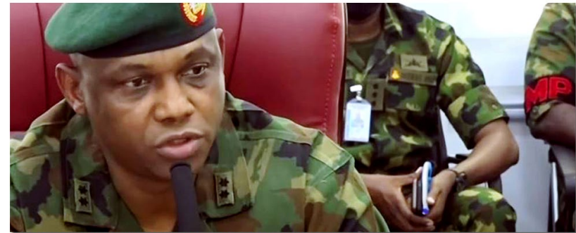
Un général nigérian prend la parole lors d'une visite de la commission sénatoriale sur l'armée.

Les commissions parlementaires qui surveillent le secteur de la sécurité jouent un rôle essentiel dans la construction d'institutions redevables, soutenables, efficaces, transparentes et professionnelles.