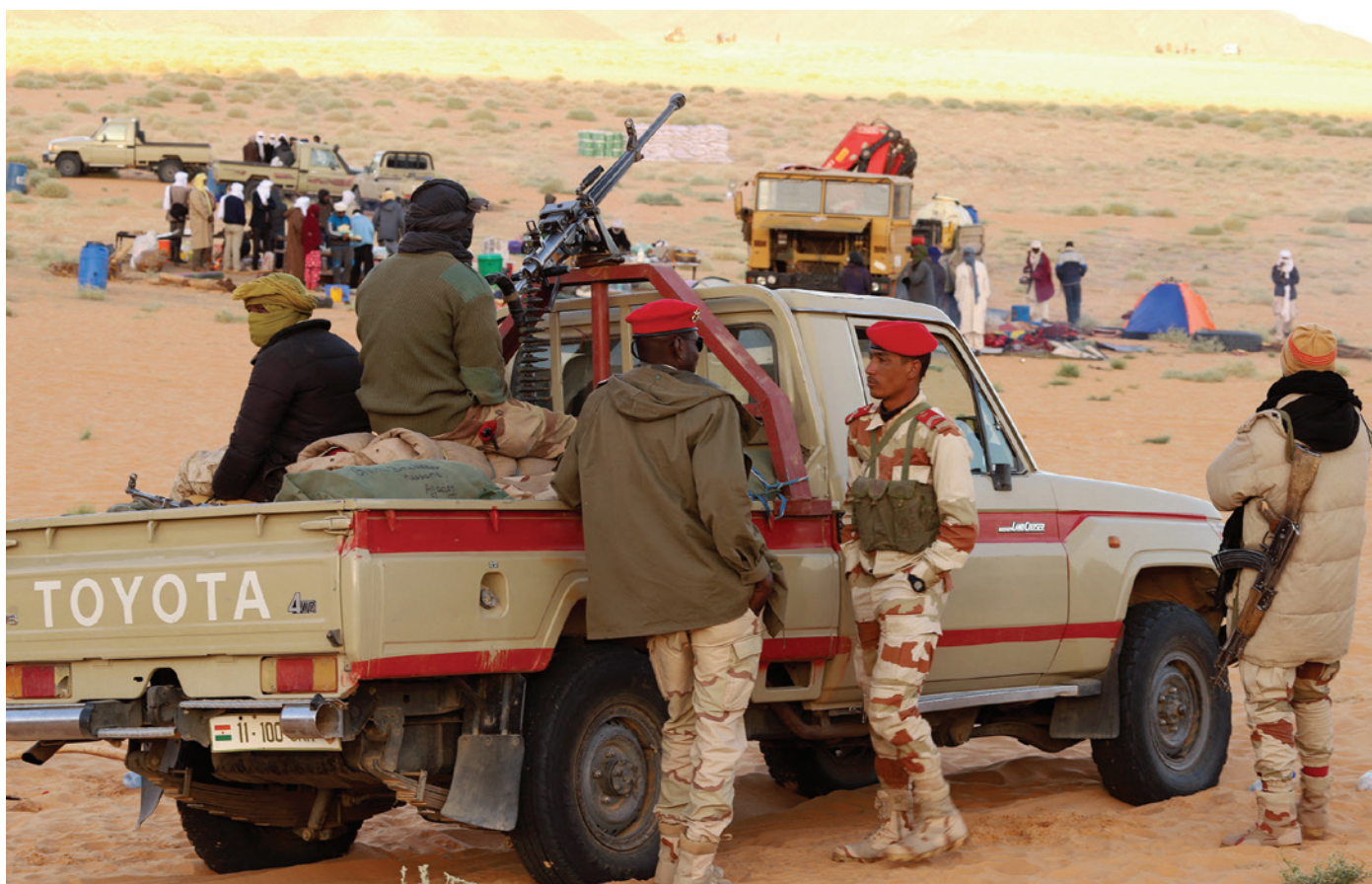
Patrulha das forças armadas do Níger na região norte de Agadez.

A justiça militar é também uma componente-chave. As gendarmarias nacionais ('gendarmeries nationales') que são comuns na África francófona desempenham um papel fulcral ao atuarem em ambas as vertentes, a militar e a de manutenção da lei. Este tipo de forças tipicamente policiam as populações civis e têm uma função de controle ou de regência, na medida em que monitorizam as forças armadas. A gendarmaria e a polícia devem estar equipadas com o pessoal e os recursos necessários para tratar das queixas de violações dos direitos humanos. No mínimo, isto deverá ajudar a reduzir os casos de abuso de civis por parte das forças de segurança, casos esse que não só são contraproducentes, como também propiciam o recrutamento de insurretos. A defesa dos direitos humanos também reforça a legitimidade governamental. Determinados grupos de tropas podem ser designados como «referências dos direitos humanos» para uma operação, o que as tornaria responsáveis por assegurar o cumprimento das disposições previstas no Direito Internacional dos Conflitos Armados e no Direito Internacional Humanitário 6 .