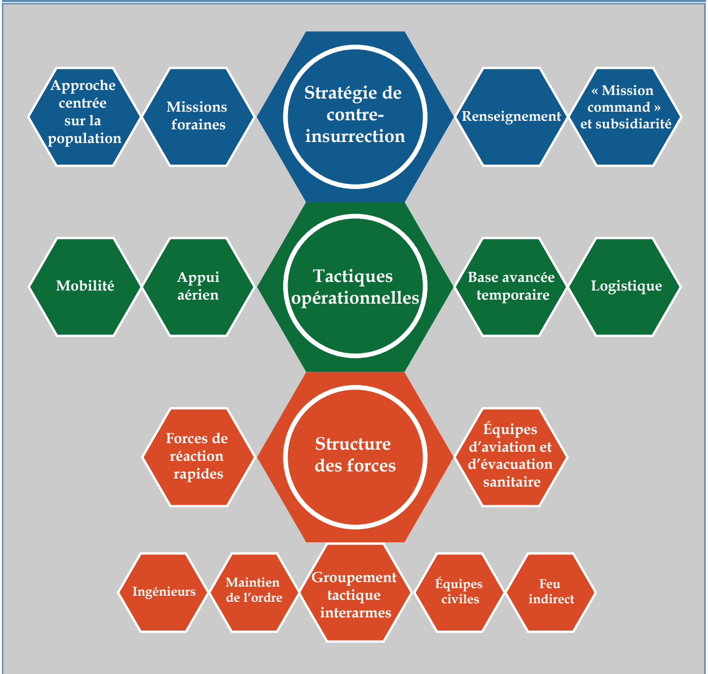
FIGURE 3. ÉLÉMENTS CONSTITUTIFS D'UNE STRATÉGIE DE CONTRE-INSURRECTION

disposent également d'artillerie remorquée, mais leur utilité compte tenu des exigences logistiques est discutable.