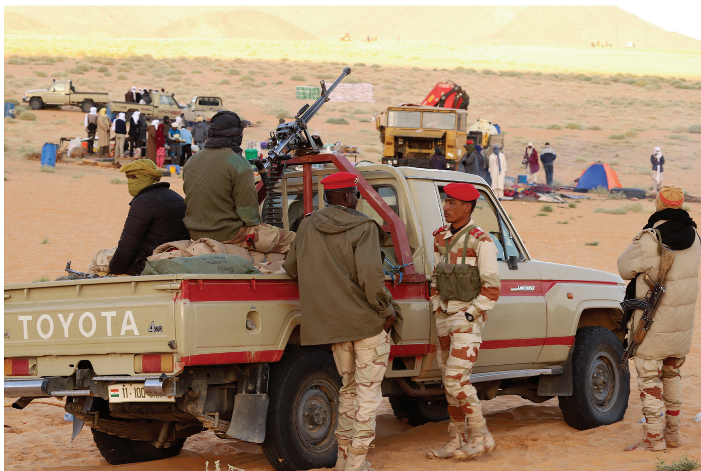
Les forces armées du Niger patrouillent dans la région d'Agadez, au nord du pays.

La justice militaire est également un élément clé. Les gendarmeries nationales, répandues en Afrique francophone, jouent un rôle central en étant à cheval entre l'armée et les forces de l'ordre. Les gendarmeries assurent généralement la police des populations civiles et ont une fonction de prévôté, ce qui signifie qu'elles surveillent les forces armées. Les gendarmeries et les polices doivent être dotées du personnel et des ressources nécessaires pour traiter les plaintes pour violation des droits humains. Cela devrait au moins permettre de réduire les cas d'abus de civils par les forces de sécurité, qui sont non seulement contre-productifs mais aussi propices au recrutement des insurgés. Le respect des droits humains renforce également la légitimité du gouvernement. Des troupes spécifiques pourraient être désignées comme « référents droits humains » pour une opération, ce qui les rendrait responsables du respect des dispositions relatives aux conflits armés et au droit international humanitaire 6 .