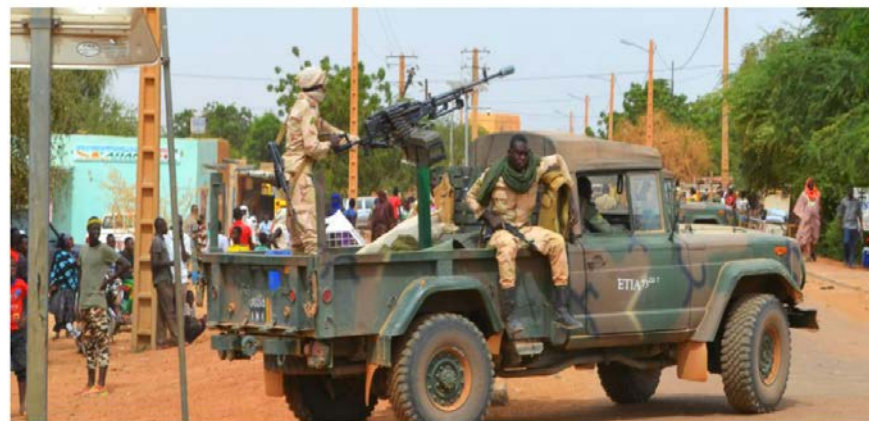
Mali soldiers on patrol in Gao the day after a suicide attack.