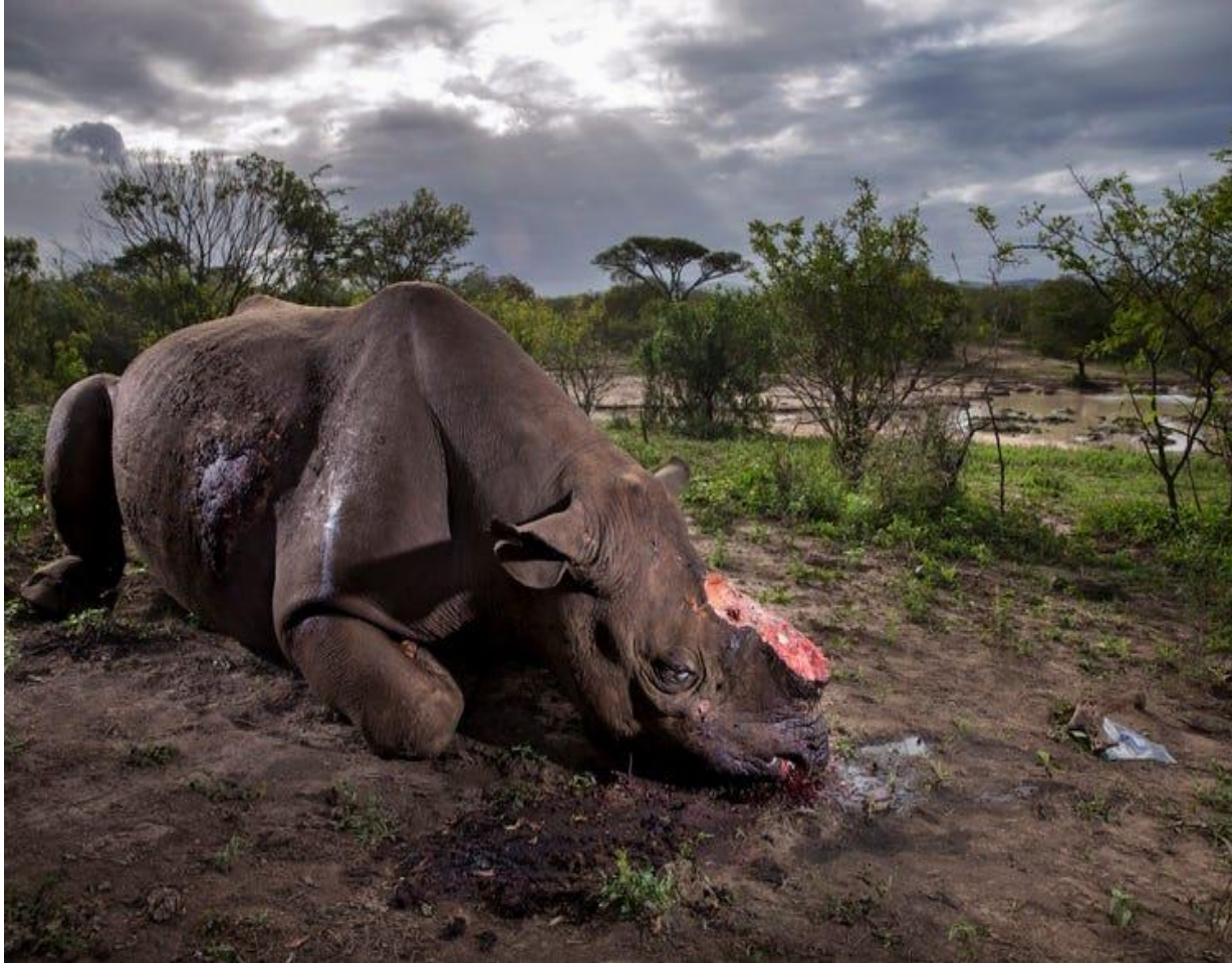
Un rhinocéros tué à la Réserve animalière de Hluhluwe Imfolozi de la République d’Afrique du Sud (2017)