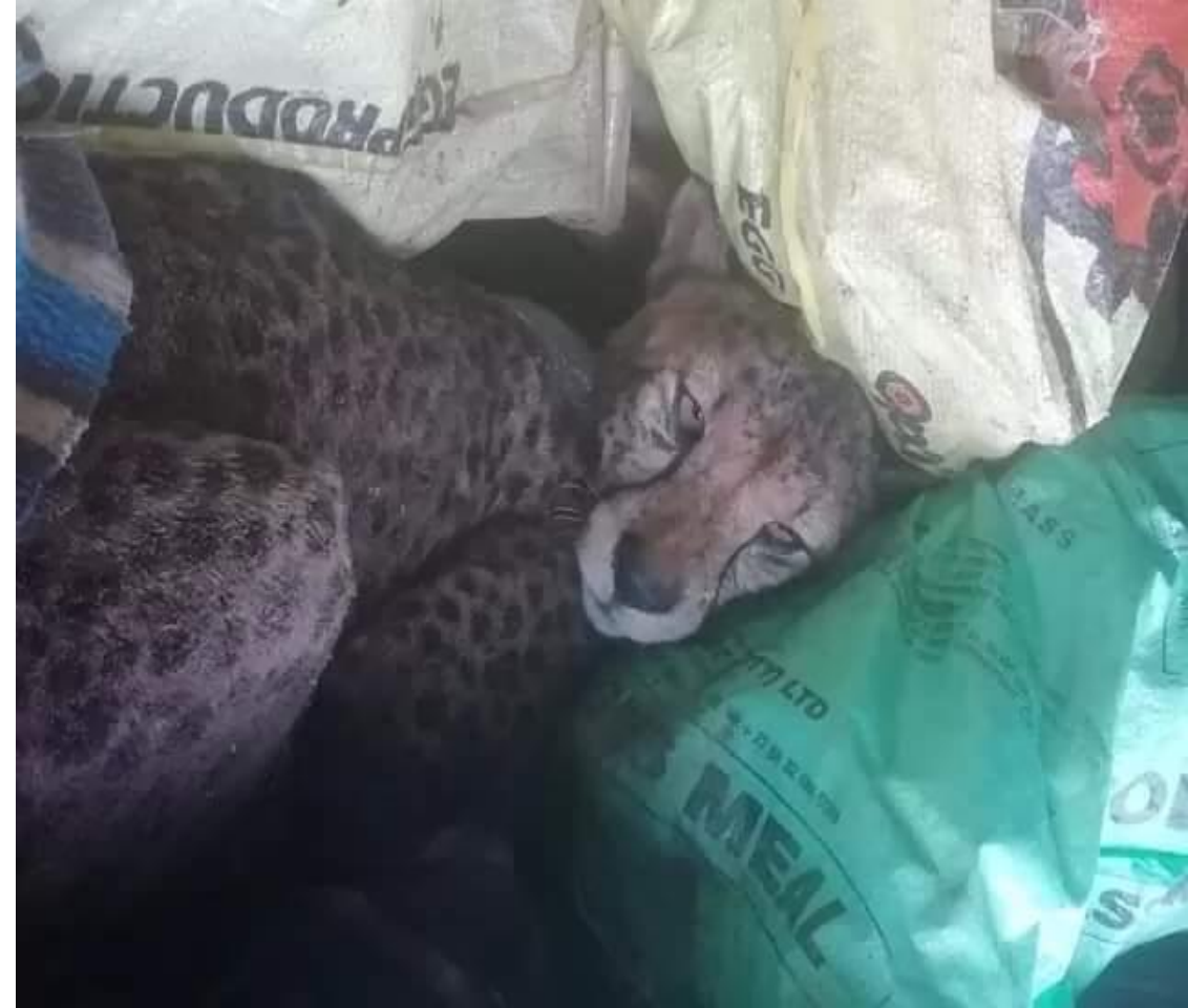
Un jeune leopard et les os de lion franchissant la frontière entre le Botswana et la République d’Afrique du Sud – Mc Carthys Rest (Dec 2019)