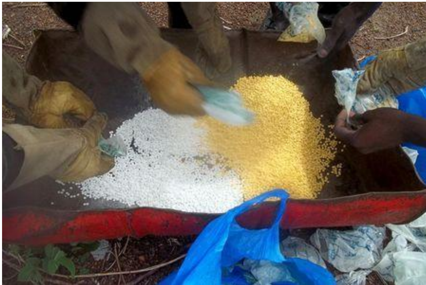
Senegalese police prepare to incinerate methamphetamines seized at the Malian border in Tambacounda, Senegal, June 29, 2014.