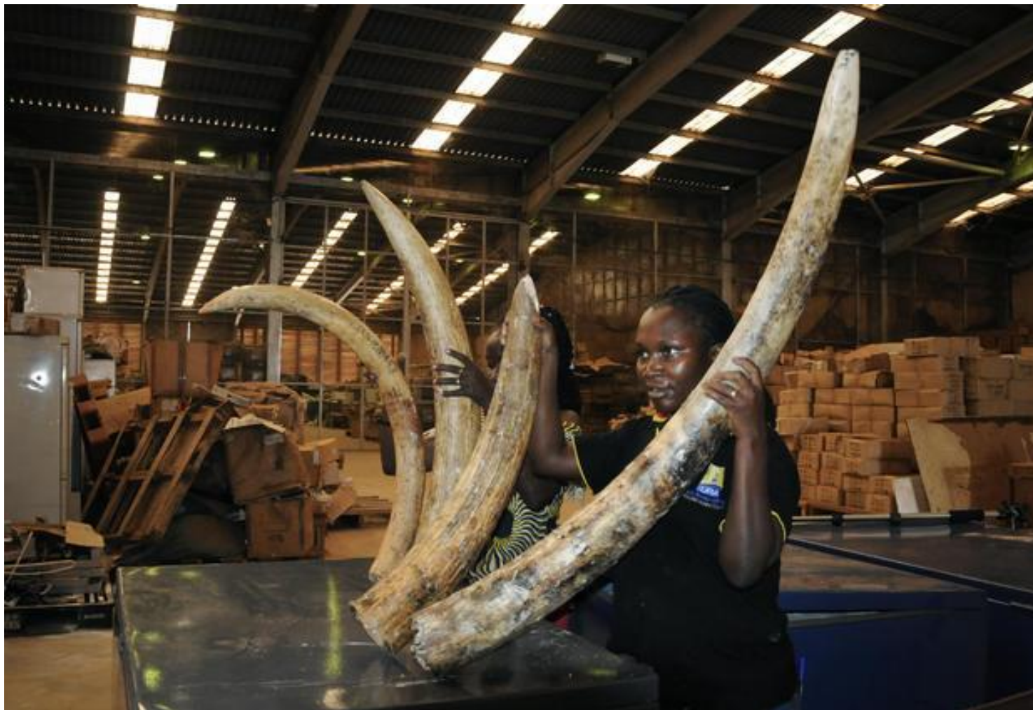
Customs officers display seized elephant tusks to the media in Kampala, Uganda, Feb. 1, 2019.