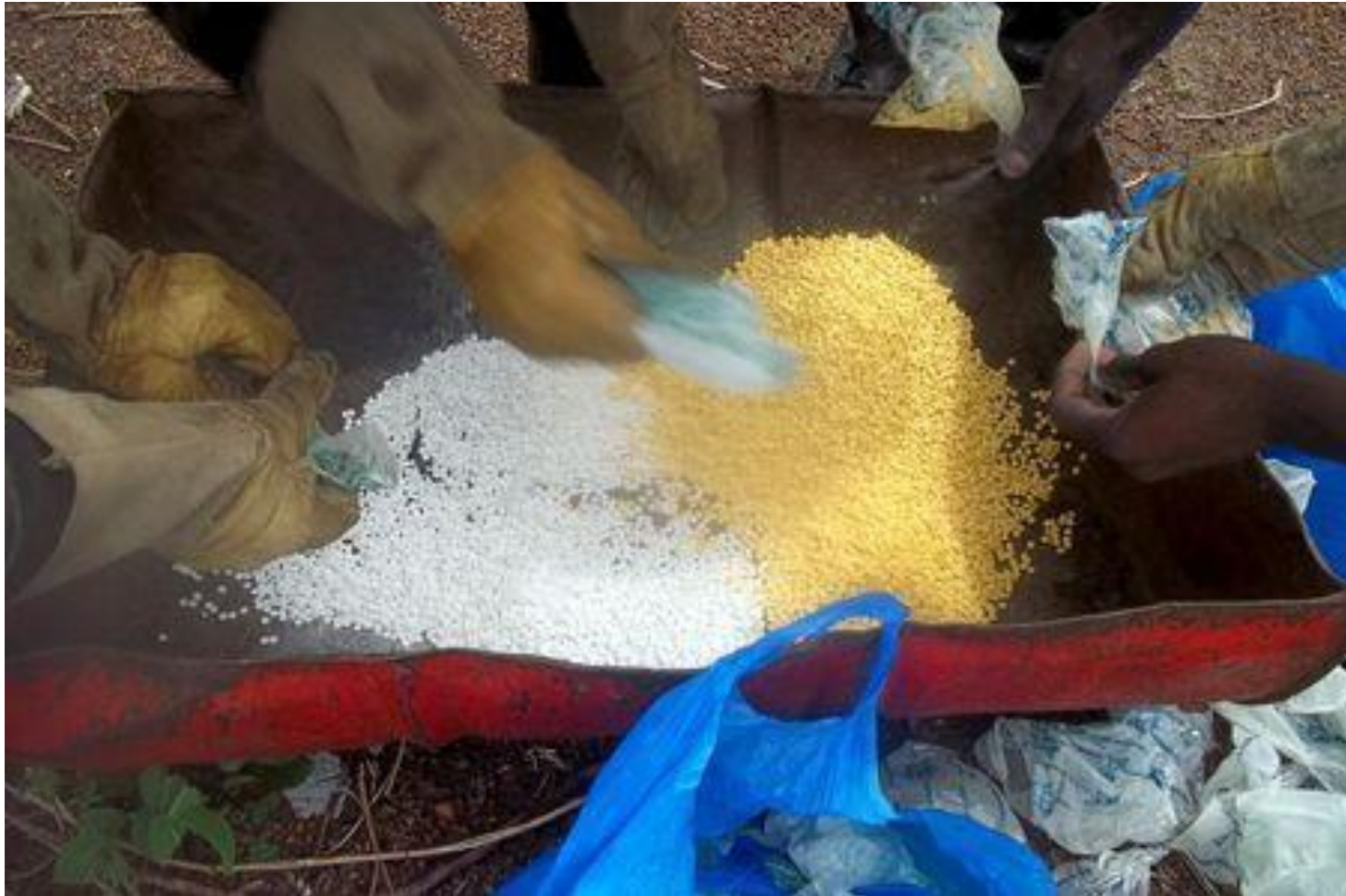
Senegalese police prepare to incinerate methamphetamines seized at the Malian border in Tambacounda, Senegal, June 29, 2014.