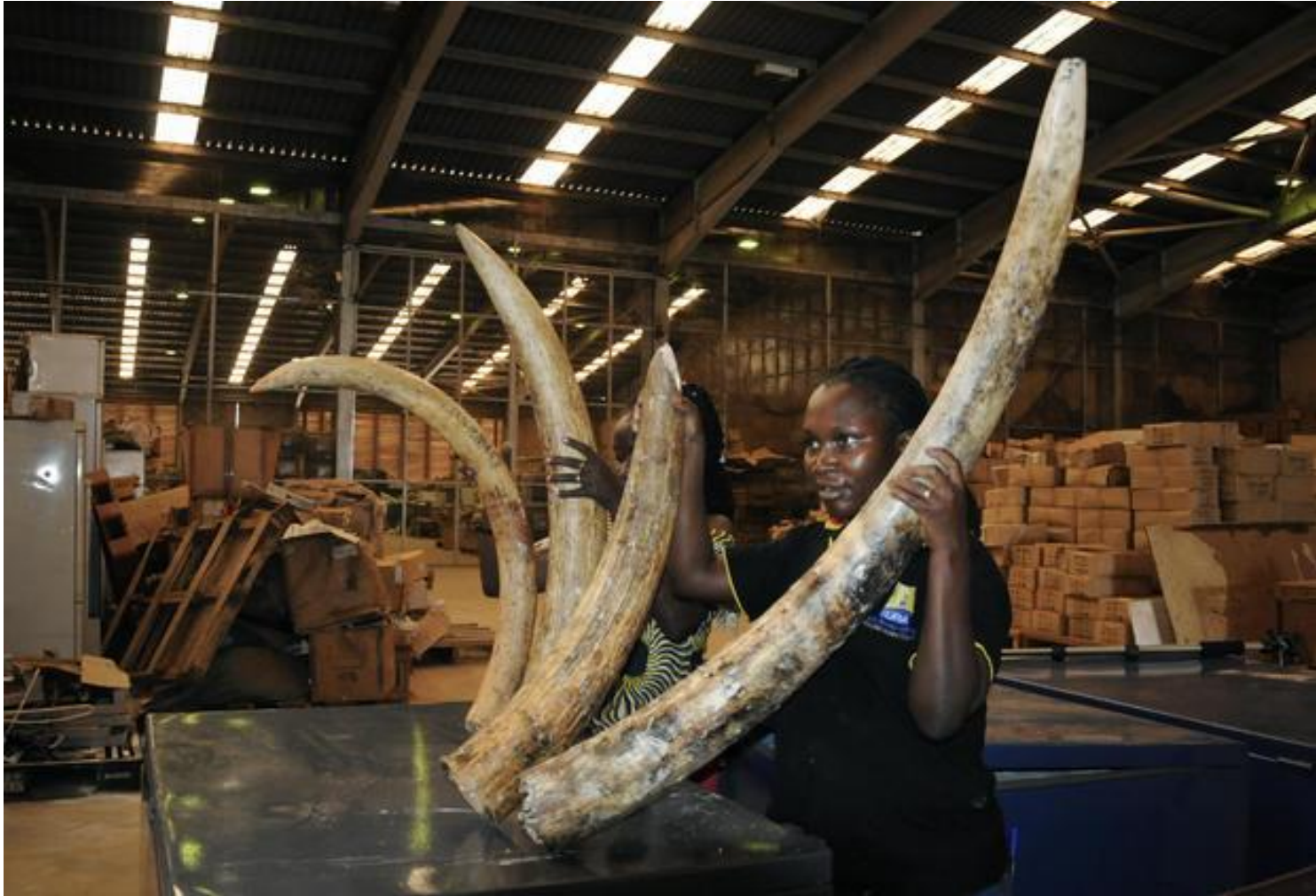
Customs officers display seized elephant tusks to the media in Kampala, Uganda, Feb. 1, 2019.