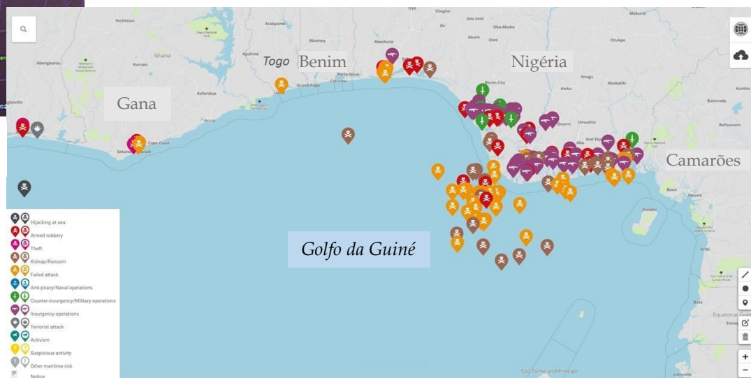
Incidentes de pirataria e segurança marítima no Golfo da Guiné (da Costa do Marfim até ao Gabão) em 2016. (MaRisk por Risk Intelligence)