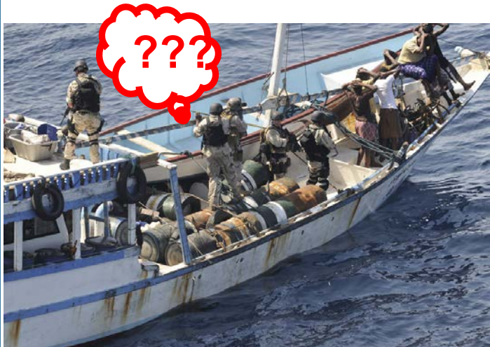
Rassemblement de preuves